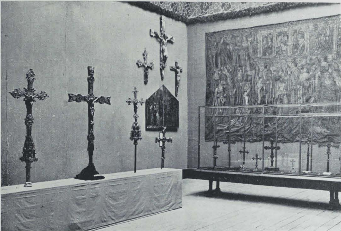
Fig. 246. — Una sala de l'Exposició de Creus

guts en un arxiu determinat. Index analític d'alguna obra o font d'interès per a l'estudi de l'Art Cristià a Catalunya.